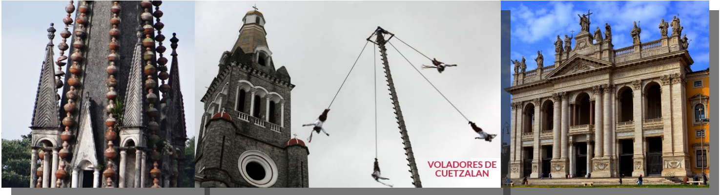
VOLADORES DE CUETZALAN

DIA 5 CUETZALAN –CASCADAS DE LAS BRISAS - JARDIN BOTANICO - YOHUALICHAN – MUSEO DE LA CERA Desayuno , ahora indicada, pasara nuestro guía para llevarnos a las hermosas cascadas las Brisas, al final de recorrido, para continuar hacia Xoxoctic significa verde en náhuatl. Este jardín botánico cuenta con uno de los más bellos escenarios naturales, rodeado de árboles siempre verdes y orquídeas de distintos colores, así como una diversidad de helechos arborescentes, entre otra vegetación, que contrasta con la neblina casi permanente que caracteriza este lugar, para posteriormente continuar Yohualichan, A 20 minutos del municipio de Cuetzalan se encuentra Yohualichan, cuyo nombre significa “la casa de la noche” en náhuatl. Esta zona arqueológica es una de las más importantes, ya que fue el primer asentamiento Totonaco, que tuvo un periodo de apogeo alrededor del año 600, hasta que emigraron al Tajín. Consta de 5 edificios principales, orientados a los 4 puntos cardinales, artesanales, dentro de los que hay que destacar de regreso al hotel visitaremos el Museo de la Cera único en su género y premiado internacionalmente, Llegada a hotel y alojamiento